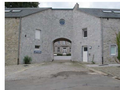
Porche d'entrée de la propriété