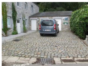
Stationnement PMR situé à côté de l'entrée du micro-gîte