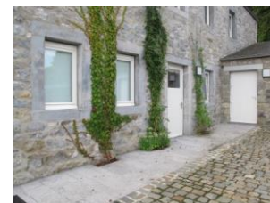
Entrée du micro-gîte PMR